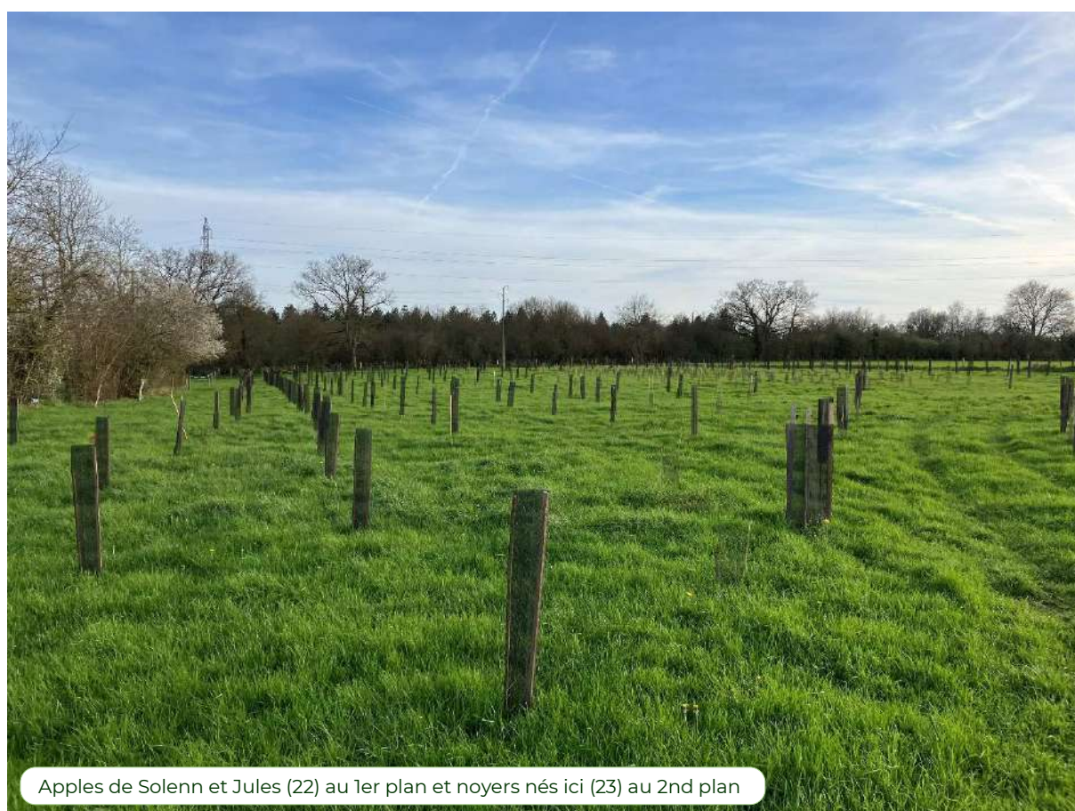
Apples de Solenn et Jules (22) au 1er plan et noyers nés ici (23) au 2nd plan