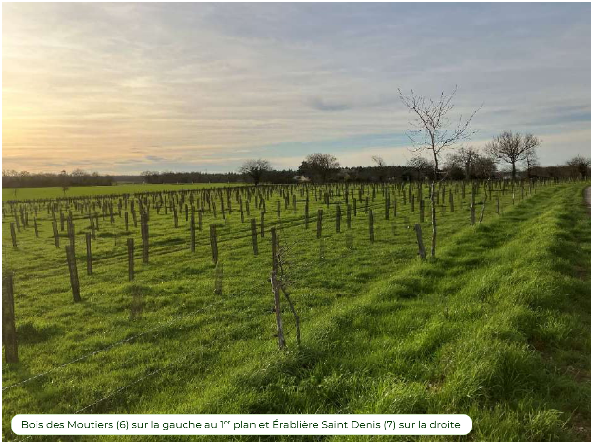
Bois des Moutiers (6) sur la gauche au 1 er plan et Érablière Saint Denis (7) sur la droite